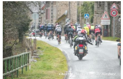
Charly Vélo - Le Coup de Bordure