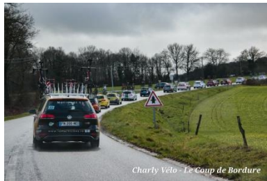
Charly Vélo - Le Coup de Bordure